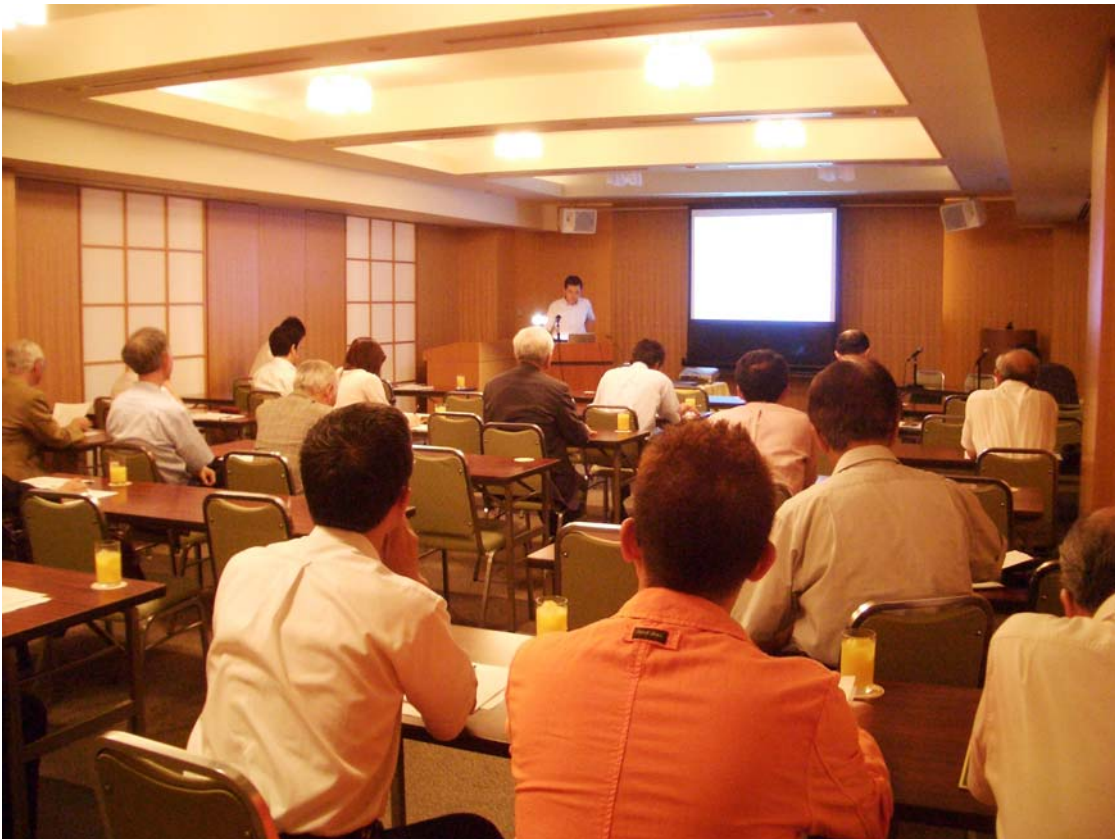
Scene of a seminar for longline fishers.